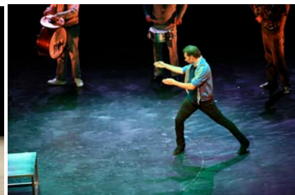
Israel Galvan/Arena Kompaniet