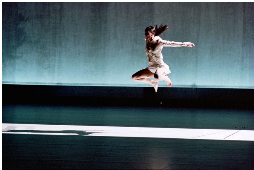
"Evening with Steve Reich", Anne Teresa de Keersmaeker/ROSAS

Alle ansattes innsatsvilje og profesjonalitet har vært avgjørende for å kunne holde så høyt aktivitetsnivå. Staben har høy arbeidsmoral og entusiasme.