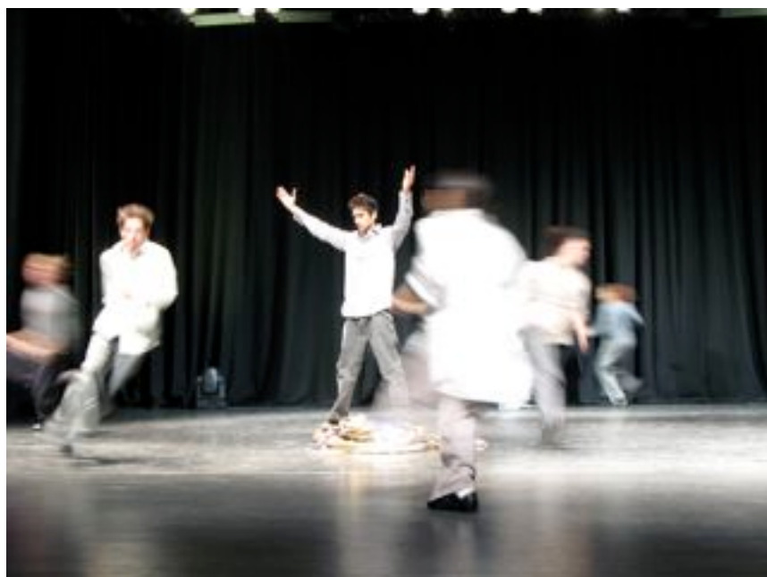
"Imitated rather than original" av Hooman Sharifi, til åpningen av Mangfoldsåret

I april kom Israel Galvan, Spanias anerkjente nyskapende flamencodanser/koreograf. Flamencoen er romfolkets sterke dansetradisjon med dype røtter i historien. Det var dans, musikk og sang i "Arena", hvis tematikk er legendariske tyrefektere og okser, fremført av noen av Flamencoens mest anerkjente utøvere internasjonalt.