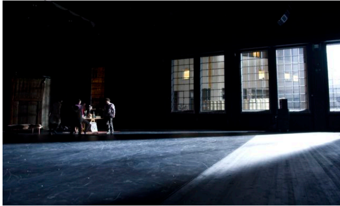
"37,7" av zvc/Ina C Johannessen

Dansens Hus er fra og med 29.02.2008 i full drift i eget hus og bygget passer godt til vår aktivitet. Det har stor betydning at vi har både Hovedscene og Studioscene, noe som gir mulighet for forestillinger av ulik størrelse, eksperimentelle forsøk, parallell aktivitet på begge scener, oppvarming for kompanier, auditions og workshops, og utleiemuligheter samtidig med egen aktivitet.