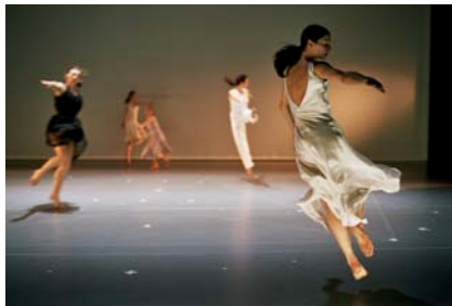
Rosas/Steve Reich Evening