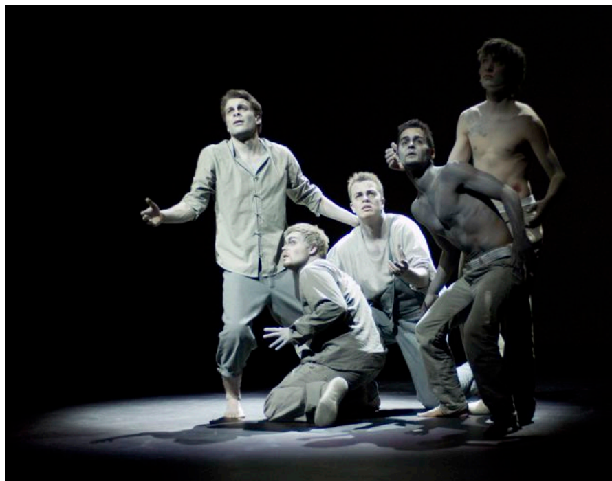
"The Dark Night of the Soul" Katrine Bølstad

DH tilbyr et unikt arbeidssted for koreografer og dansere med det store antall visninger, mange prøveuker, et stort antall norske urpremiere og faglig utvikling. Dette skaper et nytt tilbud i Norge innenfor dansekunsten. Dansens Hus er i ferd med å bli det arbeids- og møtested for kunstnere slik forutsetningen var.